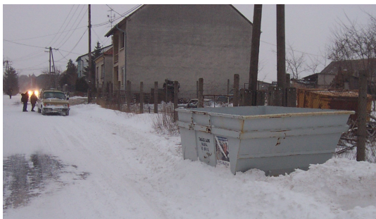
Konténer a Keresztúri út elején, az iskolával szemben