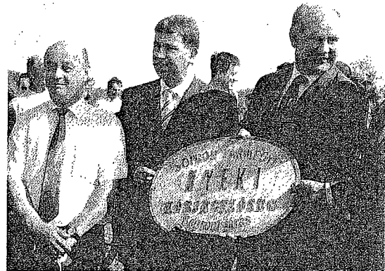
Történelmi emlék az egykori Nyéki Körjegyzőség táblája, melyet Nyék polgármestere hozott magával a határnyitásra

Nagy izgalomban kevés kép készült az éjféle találkozón, pedig nyéki barátaink mindent elkövettek, hogy ne kelljen a sötétben tapogatózni egymás köszöntő kézszorításához. Neckenmarkt község tűzoltói olyan szerkocsival vonultak fel, mely szinte nappali világítást biztosított. Megoldódtak a másik szavait kereső nyelvek, de szavak nélkül is megértettük egymást. Az eredetileg elképzelt, csupán a két képviselő-testület találkozásából, nagy színes kavalkád kerekedett. Nyékről és Harkáról is egymás után érkeztek résztvevők, akik egy-egy flaska borral, kosárka frissen sült pogácsával kedveskedtek a már korábban érkezőknek. Mintha ezekben a percekben pótolni szerettek volna sok-sok évet.