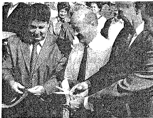
Reggel 09 óra, a magyar és az osztrák nemzeti színű szalag átvágásával jelképesen mi is beléptünk az Európai Unióba