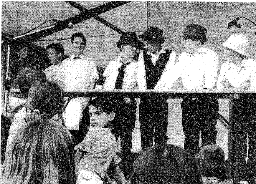
Az általános iskola 4. osztályos tanulói a "Rátóti csikótojás" c. darabot adták elő.

.....két pillanatra még egyszer a FALUNAP-ról