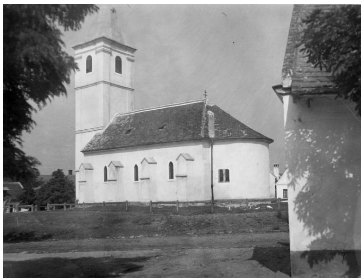
A templom déli oldala a toronnyal és a román kori apszissal.