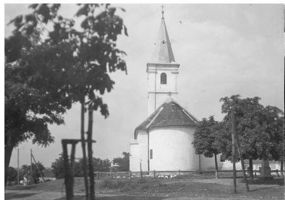
A templom a szentély felől. Csatkai Endre fotója, 1932 (Soproni Múzeum, Fotótár, 337)