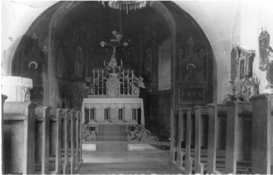
A helyreállítás előtti állapot

elé. A berendezési tárgyak közül csak az értékeesebb darabokat helyezték vissza. Új olvasópult készült. A templom körül tereprendezést végeztek.