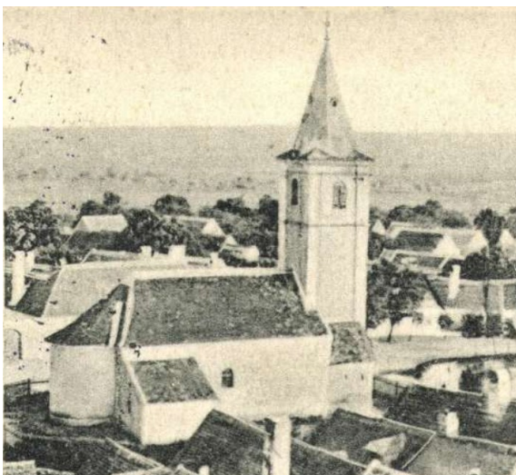
A templom 1910 körül (képeslap, részlet)

Az 1912. évi egyházlátogatási jegyzőkönyv szerint a templom jó karban volt, nem szorult tatarozásra. A celli Szűz Mária tiszteletére emelt főoltáron kívül változatlanul megvolt a Nepomuki Szent János-mellékoltár is.