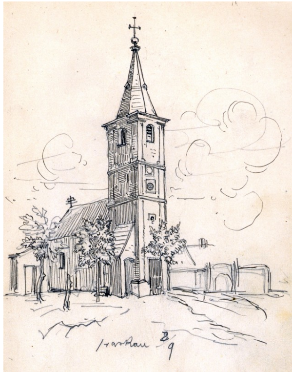
Id. Storno Ferenc rajza a templomról, 1869

1858 -ban tűzvész pusztított Harkán, melynek során a templom is károkat szenvedett, fedele a lángok martaléka lett. Az épületet Sopron város költségén helyreállították, új fedélszéket készítettek, mely cserépfedést kapott. A tetőszerkezet átépítésével megszüntették a kora barokk főpárkányt a hajó homlokzatán.