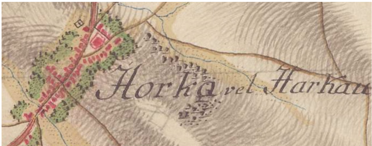
A fallal körülvelt templom az I. katonai felmérés térképén, 1784 körül